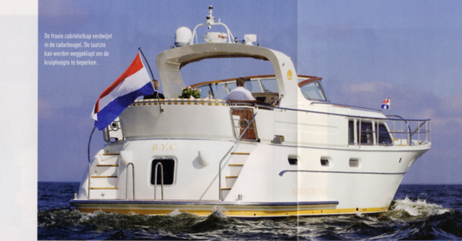
De fraaie cabrioletkap verduwt in de radarbeugel. De laatste kan worden weggeklapt om de kruiphoogte te beperken.

We varen met de Boarcruiser Retro Line 50 vanuit Stavoren op het IJsselmeer. Het schip is vol beladen (wat neerkomt op een totaal gewicht van ongeveer 35 ton), het weer is rustig en van echte golven is dan ook geen sprake. Wat vooral opvalt aan dit jacht, is de stilte aan boord. De motoren hoor je niet of nauwelijks en daar mag je de bouwers een compliment voor geven. Volgens de decibelmeter nog ruim onder de 70 steken – dat maakt deze Boarcruiser tot een hele stille jongen. Moet ook wel natuurlijk, want deze 50 is een echte passage-maker zoals dat heet. Een kruissnelheid van acht knopen past deze boot perfect. Het verbruik van de beide Perkins-motoren die voor die snelheid 1.600 toeren per minuut nodig hebben, is dan heel bescheiden en het geluidsniveau aan boord dito: onder de 60 decibel. En een dag lang 8 knopen betekent wel een kleine 200 mijl voortgang... Wij klokten een top op de gps van 10 knopen. Dat is zelfs iets boven de theoretische rompsnelheid. Harder varen dan 9 knopen heeft echter niet veel zin. De extra energie die nodig is voor een paar tienden van knopen meer, gaat dan vooral zitten in de productie van een imposante