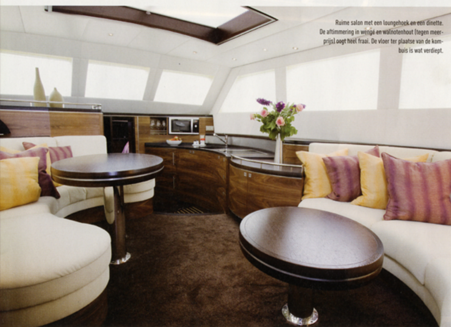
Ruime salon met een loungehoek en een dinette. De afstemming in wengé en walnotenhout (tegen meerprijs) oogt heel fraai. De vloer ter plaatse van de kombuis is wat verdiept.

De Boarnstream heeft de duidelijke keuze gemaakt een werf te willen zijn die alles behalve serieproducten bouwt. Deze 50 is daarvan opnieuw een voorbeeld. Technisch wordt voor het jacht een complete standaardlevering afgesproken, daarbuiten heeft de klant alle mogelijkheden om een schip naar eigen inzicht in te richten. (Misschien wel het extreemste voorbeeld: de werf leverde een 40-voets Classic Line met het interieur van een 60-voets Retro Line.)